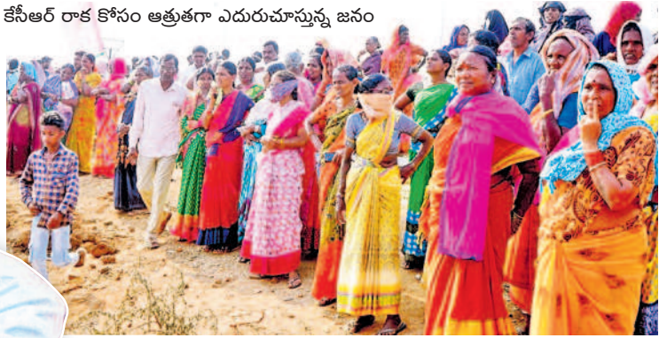
కేసీఆర్ రాక కోసం ఆత్రుతగా ఎదురుచూస్తున్న జనం