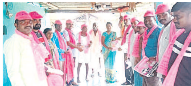
వెల్లూర్: జగదేవ్ పేటలో ఇంటింటా ప్రచారం నిర్వహిస్తున్న బీఆర్ఎస్ నాయకులు