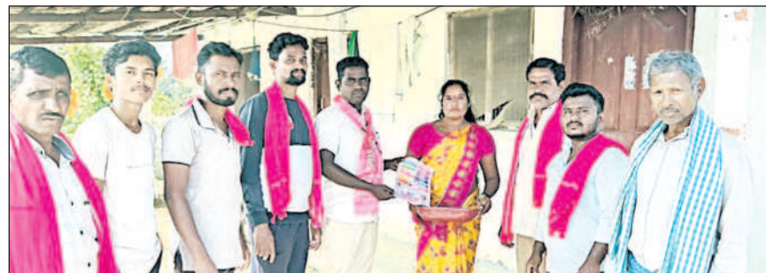
ధర్మపురి: ఆరెపల్లిలో ప్రచారం చేస్తున్న నాయకులు