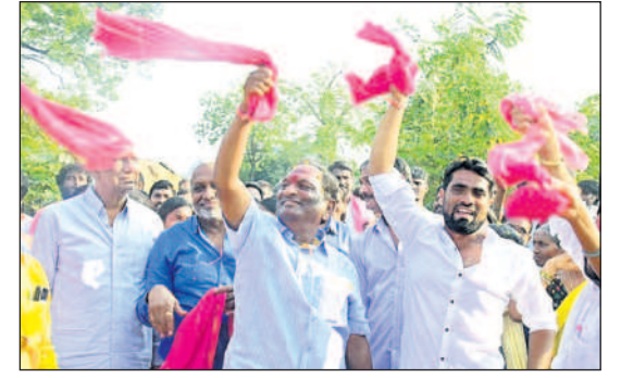
రాయలీలో కొప్పల ఈశ్వర్