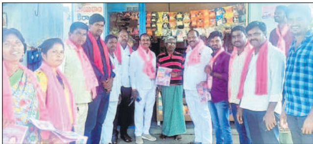
గొల్లపల్లి: ప్రచారం చేస్తున్న నాయకులు