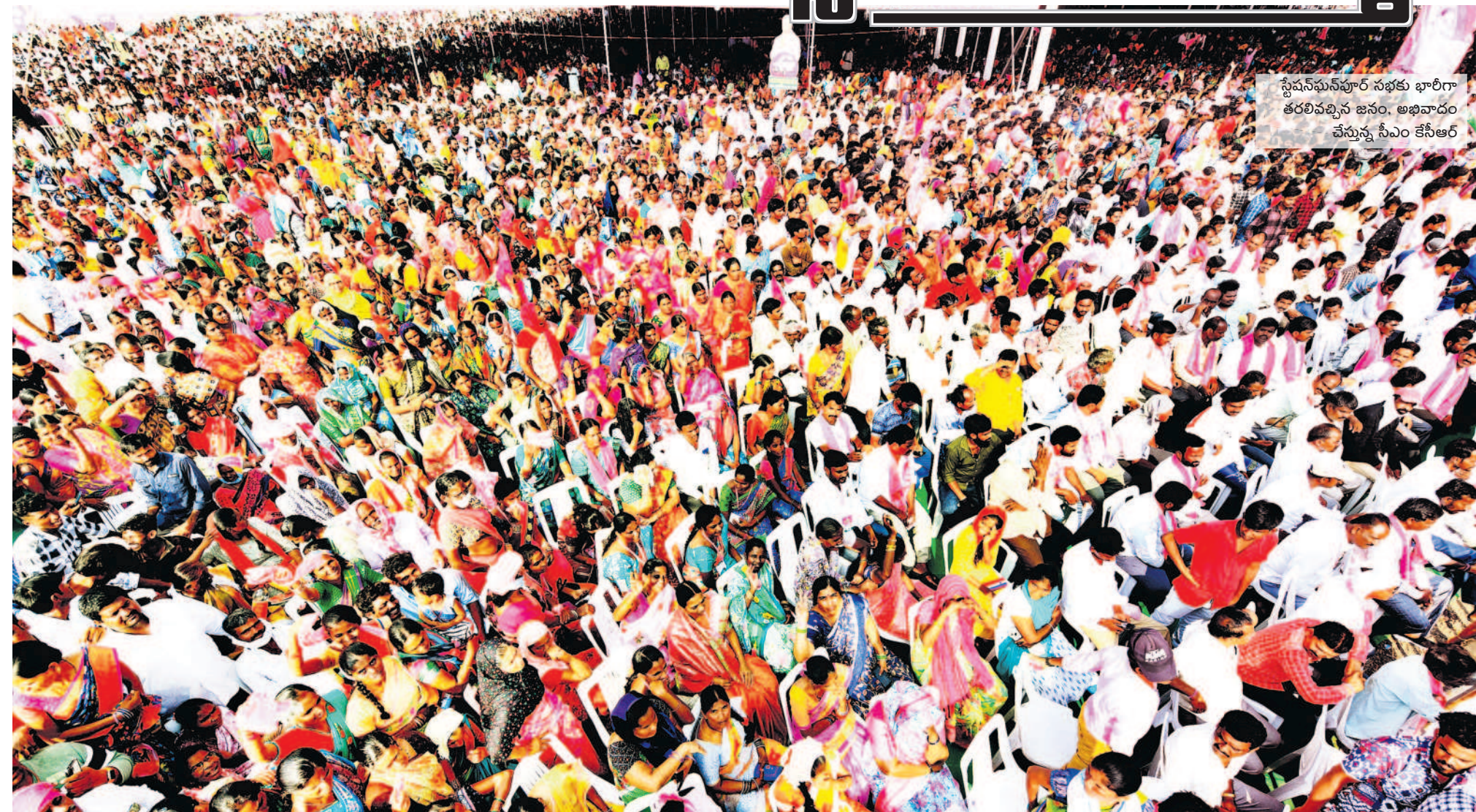
స్టేషన్ ఘనపూర్ సభకు భారీగా తరలివచ్చిన జనం, అభివాదం చేస్తున్న సీఎం కేసీఆర్

బీఆర్ఎస్ ప్రభుత్వం వచ్చిన వెంటనే అప్పర్ ప్రతినిధి