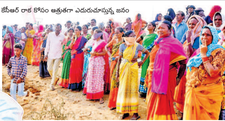
కేసీఆర్ రాక కోసం ఆత్రుతగా ఎదురుచూస్తున్న జనం