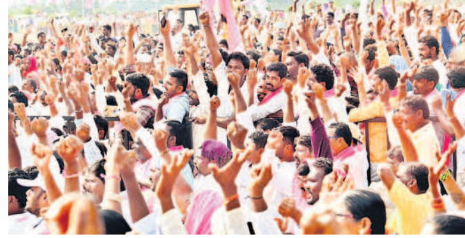
సీఎం కేసీఆర్ ప్రసంగిస్తున్న వేళ ఉత్సాహంగా జైకొడుతున్న శ్రేణులు, ప్రజలు