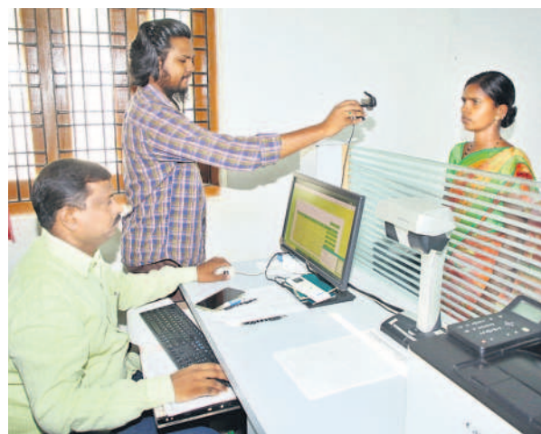
వనపర్తి తాసిల్దార్ కార్యాలయంలో ధరణి రిజిస్ట్రేషన్లు చేస్తున్న అధికారులు (ఫైల్)

సాగుకు 3 గంటల కరెంట్ చాలంటూ టీపీసీసీ చీఫ్ రేవంత్ రెడ్డి అహంకారపు మాటలపై కన్నెర్ర