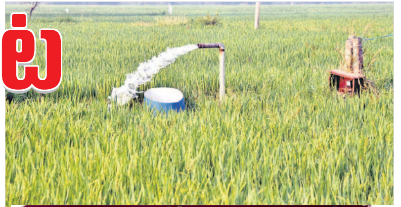
జగమాగం ఓటేస్తే రైతు బతుకు జగమే!