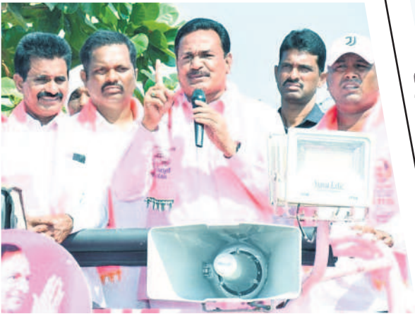
గద్దలలో మాట్లాడుతున్న ప్రభుత్వ విప్ గంపగోవర్ధన్