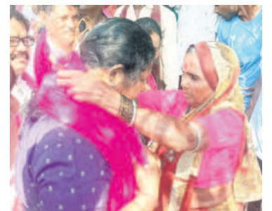
కెరమెరి : ఆసిఫాబాద్ ఎమ్మెల్యే అభ్యర్థి కోవ లక్ష్మికి ఘన స్వాగతం పలుకుతున్న మహిళలు