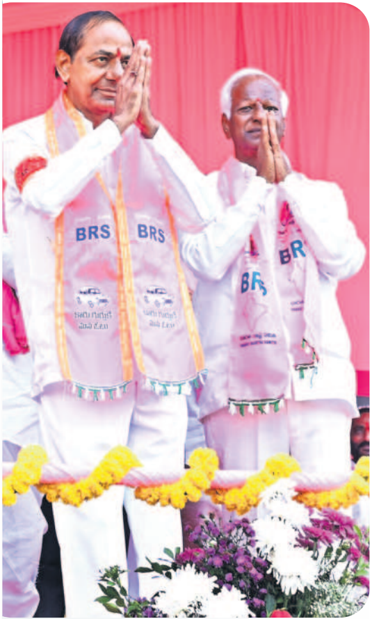
స్టేషన్ ఘనపూర్ సభకు పెద్ద ఎత్తున హాజరైన జనం, ప్రజలకు అభివాదం చేస్తున్న సీఎం కేసీఆర్, అభ్యర్థి కడియం శ్రీహరి