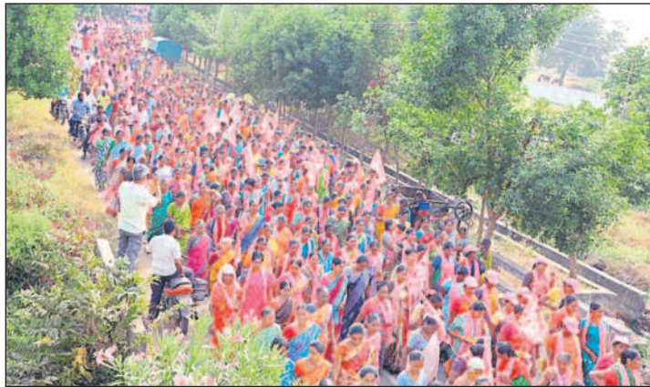
గోపాల్ పూర్లో ప్రచారానికి భారీగా తరలివచ్చిన గ్రామస్థులు