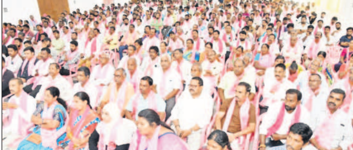
తెలంగాణభవన్లో నిర్వహించిన సమావేశంలో పాల్గొన్న బూత్ కమిటీ సభ్యులు

మైన ప్రాంతంలో కలెక్టరేట్ భవనాన్ని, జిల్లా పోలీసు కార్యాలయాలు నిర్మించి అందుబాటులోకి తెచ్చారన్నారు. ఒకప్పుడు వరంగల్, హైదరాబాద్ వంటి మహా నగరాల్లో మాత్రమే అందుబాటులో ఉన్న ఇంజనీరింగ్, మెడికల్ విద్య నేడు సిరిసిల్లలో ఏర్పాటు చేసి మన పిల్లలకు ఉన్నత విద్య అవకాశాలను అందిస్తున్నారన్నారు. అలాగే నర్సింగ్ కళాశాల, వ్యవసాయ, వ్యవసాయ పాలి టెక్నిక్, ఐటీఐ కళాశాల, గంభీరాపురంలో కేజీ టూ పీజీ విద్యాలయాల సముదాయం ఏర్పాటు కావడంతో సిరిసిల్ల ఎద్యుకేషన్ హబ్గా మారినదన్నారు. సిరిసిల్ల-కరీంనగర్-కామారెడ్డి రహదారులను విస్తరించి సెంటర్ లైటింగ్ను ఏర్పాటు చేసి, ఈ ప్రాంతానికి వన్నె తెచ్చారని కొనియాడారు. నాడు ఎట్టుండే సిరిసిల్ల.. నేడు ఎట్టుయ్యిందో.. మన కళ్లముందే కనిపిస్తున్నదన్నారు. గత పాలకుల హయాంలో వస్తూ పరిశ్రమకు సరైన విద్యుత్ లేక దుర్భరమైన పరిస్థితి ఉండేదన్నారు. బీఆర్ఎస్ ప్రభుత్వం ఏర్పాటు తర్వాత రాష్ట్ర వ్యాప్తంగా అందిస్తున్న నిరంతర విద్యుత్ సిరిసిల్ల వస్తూ పరిశ్రమలో వెలుగులు నింపిందని చెప్పారు. తెలంగాణకే తలమానికంగా మంత్రి కేటీఆర్ సిరిసిల్లను తీర్చిదిద్దారని కొనియాడారు. నేతన్న