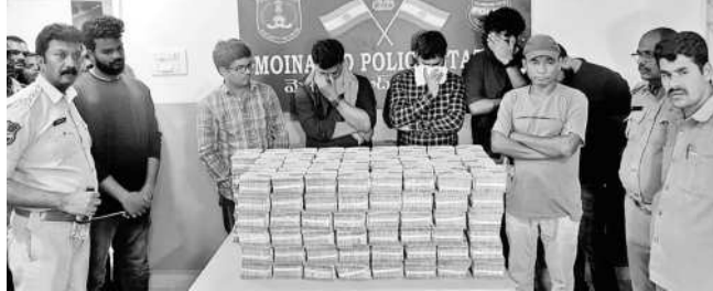
తనిఖీల్లో భాగంగా ఇటీవల పోలీసులు స్వాధీనం చేసుకున్న నగదు