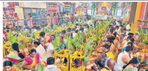
చీర్యాల శ్రీ లక్ష్మీనర్సింహస్వామి ఆలయంలో సత్యనారాయణ ప్రతాలను నిర్వహిస్తున్న భక్తులు

కీసర, నవంబర్ 20: కార్తీకమాసంలో కావడంతో కీసర మండలం చీర్యాల శ్రీ లక్ష్మీనర్సింహస్వామి ఆలయంతో పాటు కీసరగుట్ట భక్తులతో కొలహాలంగా మారింది. చీర్యాల శ్రీ లక్ష్మీనర్సింహస్వామి ఆలయంలో స్వర్ణ పుష్పాలతో ప్రత్యేక పూజలు చేశారు. భక్తులు సత్యనారాయణ ప్రతాలను ఆచరించారు. కీసర గుట్ట ఆయలంలో గర్భాలయంలో స్వామివారికి మహాన్యాస పూర్వక రుద్రాభిషేకాన్ని నిర్వహించారు.