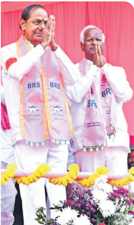
స్టేషన్ ఘనపూర్ సభకు పెద్ద ఎత్తున హాజరైన జనం, ప్రజలకు అభివాదం చేస్తున్న సీఎం కేసీఆర్, అభ్యర్థి కడియం శ్రీహరి