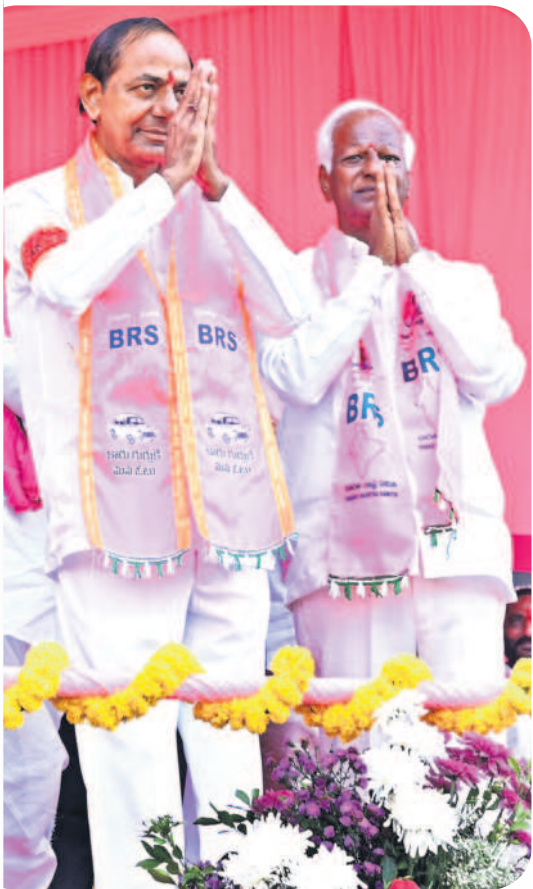
స్టేషన్ ఘనపూర్ సభకు పెద్ద ఎత్తున హాజరైన జనం, ప్రజలకు అభివాదం చేస్తున్న సీఎం కేసీఆర్, అభ్యర్థి కడియం శ్రీహరి