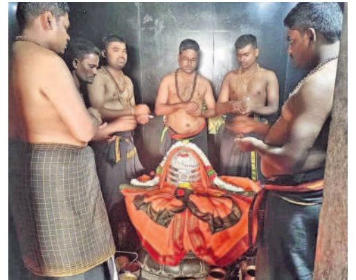
జ్యోతిర్లింగానికి ప్రత్యేక పూజలు చేస్తున్న అయ్యప్ప స్వాములు