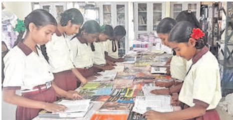
రామాయంపేట: గ్రంథాలయల వారోత్సవాల్లో భాగంగా నవలలు చదువుతున్న విద్యార్థులు, అధ్యాపకులు