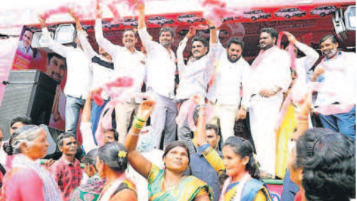
చెన్నూర్ రూరల్ : ప్రచారంలో నృత్యం చేస్తున్న చెన్నూర్ నియోజకవర్గ అభ్యర్థి, ఐపీ బాల్యనుమనీ, నాయకులు