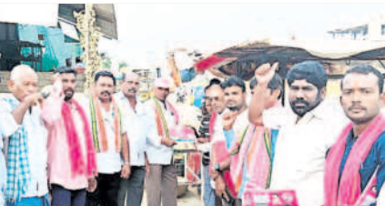
భీమారంలో ప్రచారం నిర్వహిస్తున్న నాయకులు

మండమర్రిలో హోరెత్తిన బీఆర్ఎస్ ఎన్నికల ప్రచారం మండమర్రి, నవంబర్ 20: మండమర్రి మున్సిపాలిటీ పరిధిలోని కార్మిక కాలనీలతో పాటు గాంధీనగర్, రాజీవ్ నగర్, శాంతినగర్, యాపల్, శ్రీపతి నగర్, దీపక్ నగర్, రామన్ కాలనీ, అంగడిబజార్ ఏరియా, సీఎస్సీ రోడ్డు ఏరియాల్లో బీఆర్ఎస్ అనుబంధ సంఘాల నాయకులు, కార్యకర్తలు, మహిళా నాయకురాళ్లు, కార్యకర్తలు ర్యాలీలు తీశారు. ఈ కార్యక్రమంలో బీఆర్ఎస్, డి.బీ.జీ.కే.ఎస్, మహిళా విభాగం, యూత్, సోషల్ మీడియా వారియన్స్, నాయకులు, కార్యకర్తలు పాల్గొన్నారు.