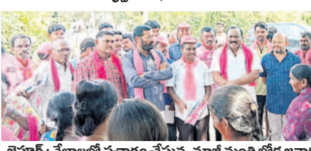
జైపూర్ : వేలాలలో ప్రచారం చేస్తున్న మాజీ మంత్రి బోడ జనార్ధన్, నాయకులు