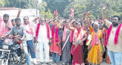
రామకృష్ణపూర్ : 17వ వార్డు భగత్ సింగ్ నగర్ లో..