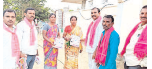
మామిడిగట్టు గ్రామంలో ప్రచారం చేస్తున్న బీఆర్ఎస్ నాయకులు