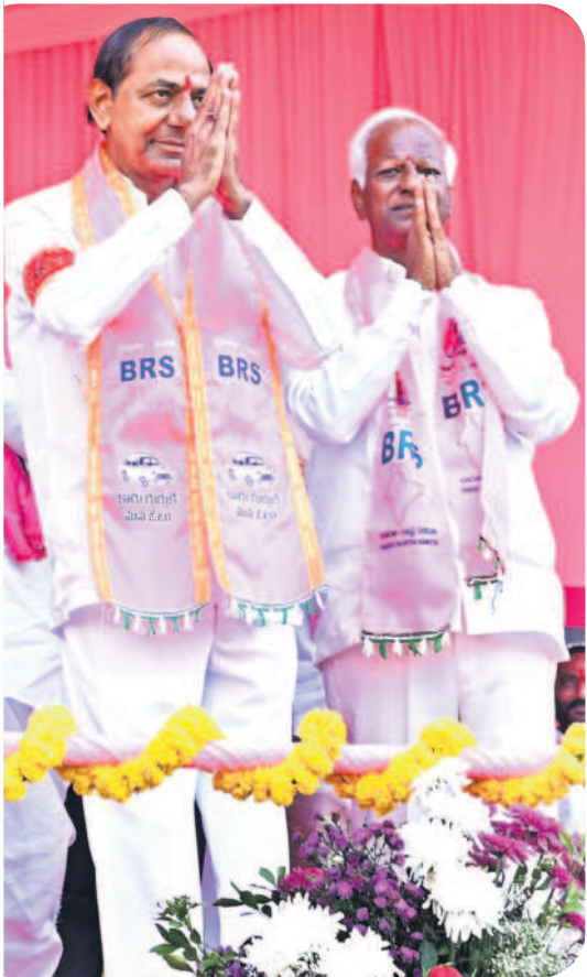
స్వేషన్ ఘనపూర్ సభకు పెద్ద ఎత్తున హాజరైన జనం, ప్రజలకు అభివాదం చేస్తున్న సీఎం కేసీఆర్, అభ్యర్థి కడియం శ్రీహరి