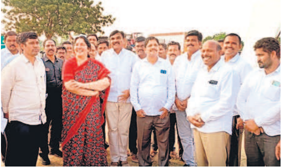
మరిపెడలో మాట్లాడుతున్న మంత్రి సత్యవతిరాధోడ్

24 గంటల కంటే, మిషన్ భగీరథ వంటి పథకాలు అమలు కావడం లేదన్నారు. కల్యాణలక్ష్మి, షాద్ ముబారక్, ఆసరా పింఛన్లు రూ.5016, దివ్యాంగులకు రూ.6016, రూ.400 కే వంట గ్యాస్ సిలిండర్, రైతు బంధు రూ.16వేలు, రైతుబీమా రూ.5లక్షలు, సీఎం కేసీఆర్ బీమా రూ.5లక్షలు, రూ.10లక్షల దళితబంధు వంటి పథకాలతో పేదలకు ఎంతో మేలు జరుగుతున్న దన్నారు. ఉమ్మడి రాష్ట్రంలో కునారిల్లిన సాగురంగానికి సీఎం కేసీఆర్ ప్రాజెక్టుల కట్టి జీవం పోసినట్లు తెలిపారు. 3 కోట్ల టన్నుల దాన్యం దిగుమతి చేసే రాష్ట్రంగా తెలంగాణ అందగడం కేసీఆర్ సంకల్పబలానికి నిదర్శమన్నారు. సుదీర్ఘకాలం దేశాన్ని పాలించిన కాంగ్రెస్