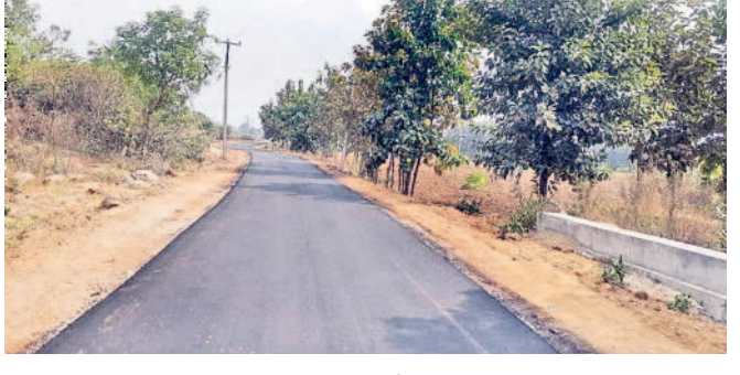
తండాలకు ఏర్పాటు చేసిన తారు రోడ్డు

Sd/-K. KESAVA RAO Advocate, Mahabubabad.