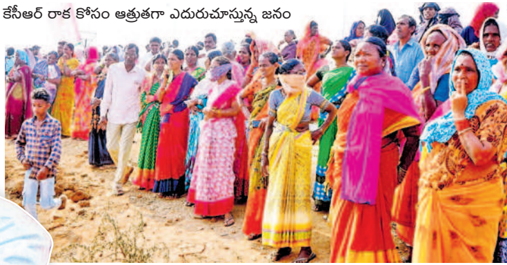
కేసీఆర్ రాక కోసం ఆత్రుతగా ఎదురుచూస్తున్న జనం