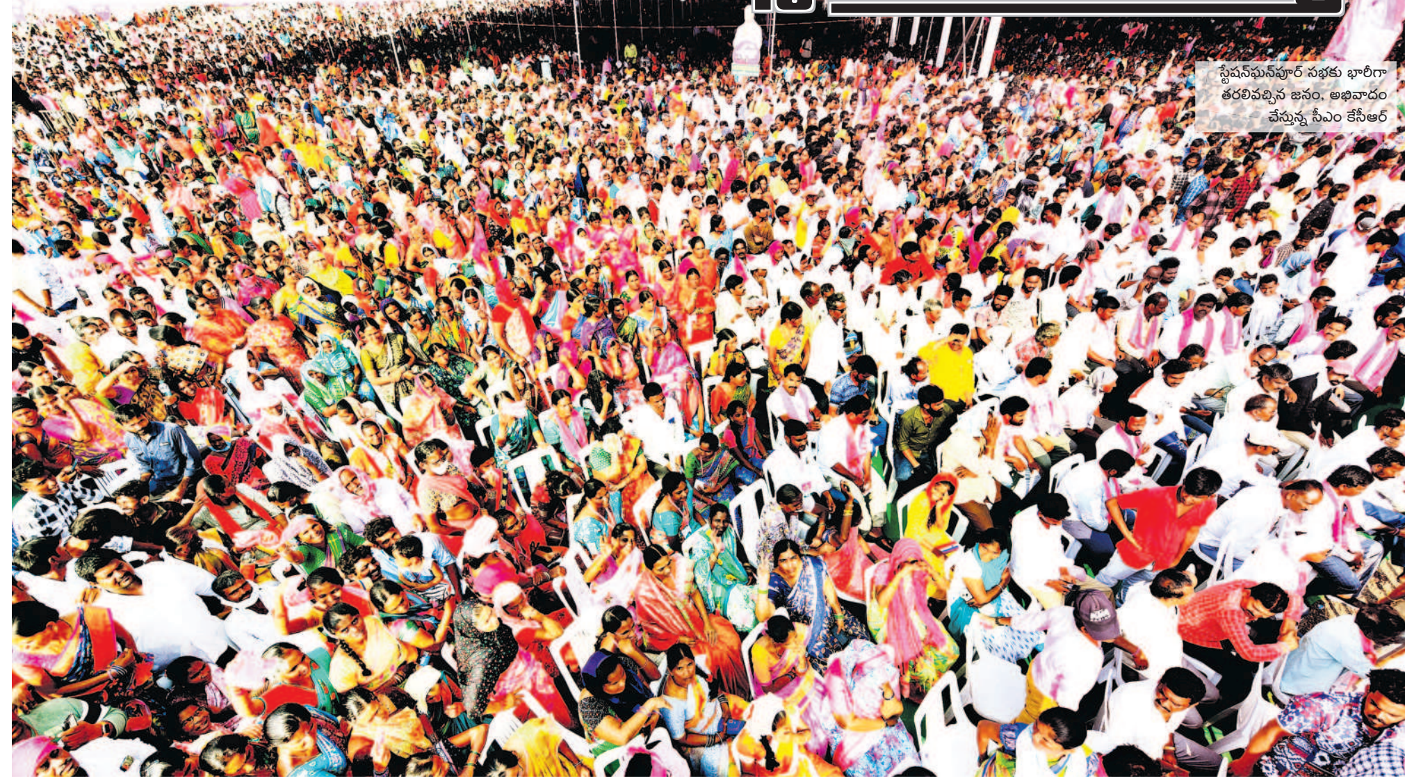
స్టేషన్ ఘనపూర్ సభకు భారీగా తరలివచ్చిన జనం, అభివాదం చేస్తున్న సీఎం కేసీఆర్