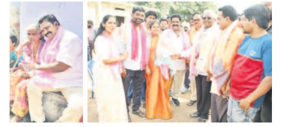
ఇల్లెందు: వృద్ధురాలిని ఓటు అభ్యర్థిస్తున్న మడత