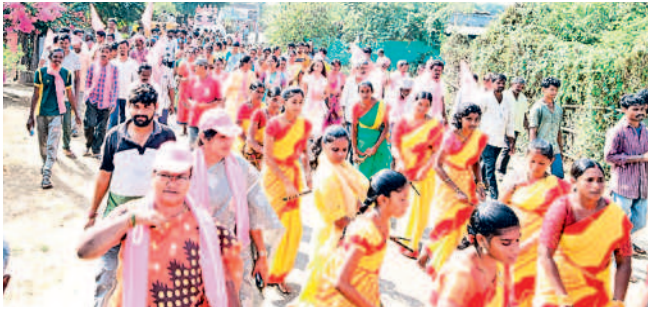
ఎన్నికల ప్రచారంలో భాగంగా ర్యాలీగా వస్తున్న ప్రజలు