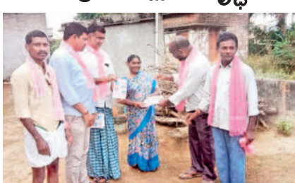
కరపత్రాలు అందజేస్తున్న బీఆర్ఎస్ నాయకులు

మహబూబాబాద్ రూరల్, నవంబర్ 20: సీఎం కేసీఆర్, బీఆర్ఎస్ పాలనలో నే గ్రామాలు అభివృద్ధి చెందా యని బీఆర్ఎస్ బీసీ మండల నాయకుడు నలమాస సుధా కర్ అన్నారు. సోమవారం జంగిలికొండ గ్రామంలోని తండాల్లో పార్టీ నాయకులతో కలిసి ఇంటింటా ట్రచారం