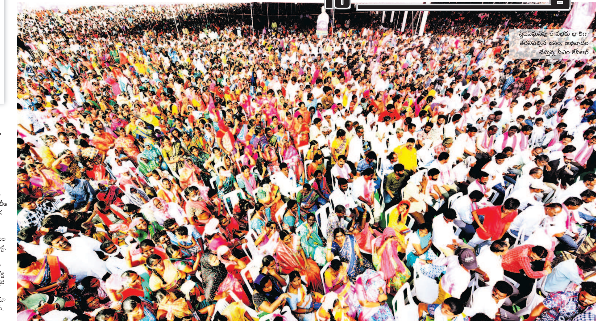
స్టేషన్ ఘనపూర్ సభకు భారీగా తరలివచ్చిన జనం, అభివాదం చేస్తున్న సీఎం కేసీఆర్