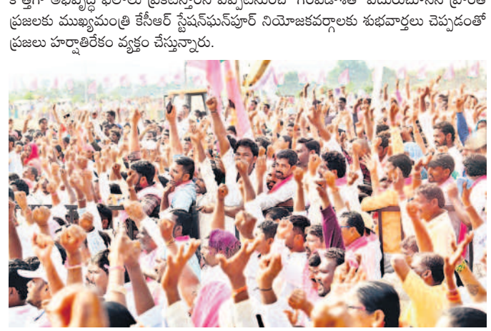
సీఎం కేసీఆర్ ప్రసంగిస్తున్న వేళ ఉత్సాహంగా జైకొడుతున్న శ్రేణులు, ప్రజలు