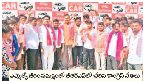
ఎమ్మెల్యే బీరం హర్షవర్ధన్ రెడ్డి బీఆర్ఎస్ లో చేరిన కాంగ్రెస్ నేతలు