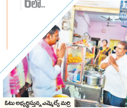
ఓటు అభ్యర్థిస్తున్న ఎమ్మెల్యే మర్రి