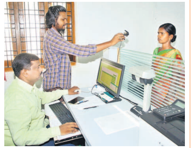
వనపర్తి తాసిల్దార్ కార్యాలయంలో ధరణి రిజిస్ట్రేషన్లు చేస్తున్న అభికారులు (ఫైల్)

క్షణాల్లో రిజిస్ట్రేషన్.. నిమిషాల్లో మ్యూటీపేషన్.. ఇది ధరణి ప్రత్యేకం.. ఇంత మంచి పోర్టల్ను తొలగించి.. పాత పటేల్, పట్వారీ వ్యవస్థను తీసుకొస్తామని కాంగ్రెస్ నేతలపై వ్యాఖ్యలపై రైతులు కన్నెర చేస్తున్నారు. మళ్ళీ పాత పద్ధతిని తీసుకొస్తామని చెప్పున్న ప్రకటనలతో ఆందోళన చెందుతున్నారు. మా భూములు లాక్కోవాలని.. హక్కులు హరించాలని చూస్తే సహించేది లేదని, ఓటుతో బుద్ధి చెబుతామని కర్షకులు ముక్తకంఠంతో చెబుతున్నారు. పహణీ, ఆర్గోఆర్ నకలు పుట్టించి మా భూములపై బినామీలు రుణాలు తీసుకొని కష్టాల పాలు చేసిన వ్యవస్థ మాకొద్దంటూ నినాదిస్తున్నారు. మళ్ళీ పాత వ్యవస్థ తెచ్చి పహణీలో 56 కాలమ్స్ చేరుస్తామని చెబుతున్న ప్రకటనలపై తీవ్ర ఆగ్రహం వ్యక్తమవుతున్నది. దీంతో దళారులు పుట్టుకొస్తారని.. లంచాలు ఇవ్వందే పనులు జరగవని అభిప్రాయపడుతున్నారు. గతంలో రెవెన్యూ అధికారులతో అన్నదాతలు పడిన కష్టాలను గుర్తు చేసుకుంటున్నారు. ధరణితో మా భూములు మాకు దక్కాయని.. అమ్మాలన్నా కొనుగోలు చేయాలన్నా నిమిషాల్లో పని పూర్తవుతుందని.. మా భూముల వివరాలు సెల్ ఫోన్లో చూసుకుంటున్నాం.. అలాంటి వ్యవస్థను బంగాళాఖాతంలో వేస్తామని బీపీసీసీ చీఫ్ రేవంత్ రెడ్డి వ్యాఖ్యలు చేయడం సబబు కాదని ఆగ్రహం వ్యక్తం చేస్తున్నారు.