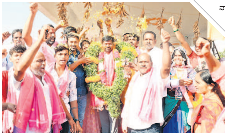
దేవదారి కుంటతండాలో విప్ గువ్వల బాలరాజును గజమాలతో సన్మానిస్తున్న గిరిజనులు