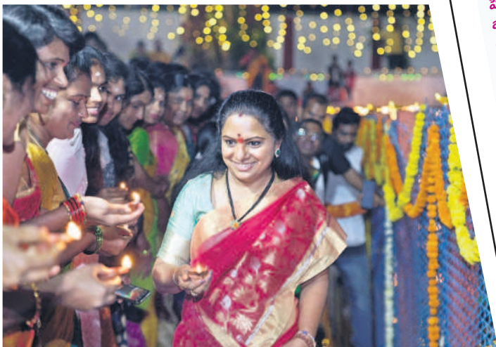
కార్తీక దీపంతో ఎమ్మెల్యే కవిత