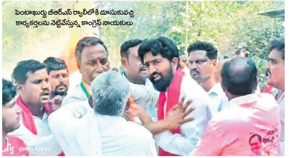
పెంటాఖుర్దు బీఆర్ఎస్ ర్యాలీలోకి దూసుకువచ్చి కార్యకర్తలను నెట్టివేస్తున్న కాంగ్రెస్ నాయకులు