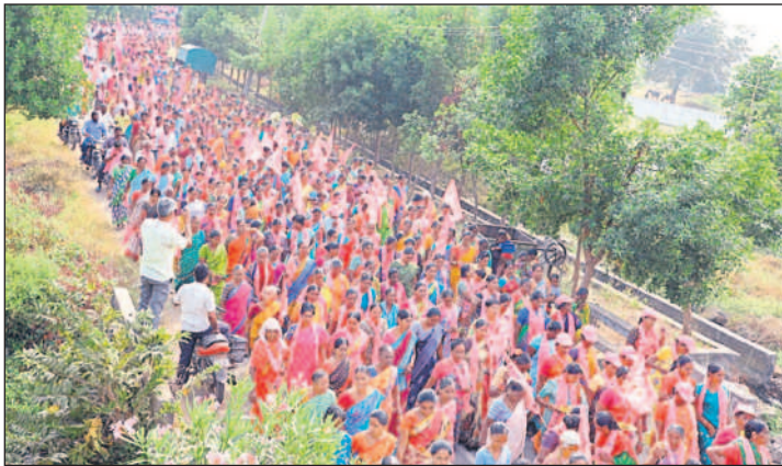
గోపాల్పూర్లో ప్రచారానికి భారీగా తరలివచ్చిన గ్రామస్థులు