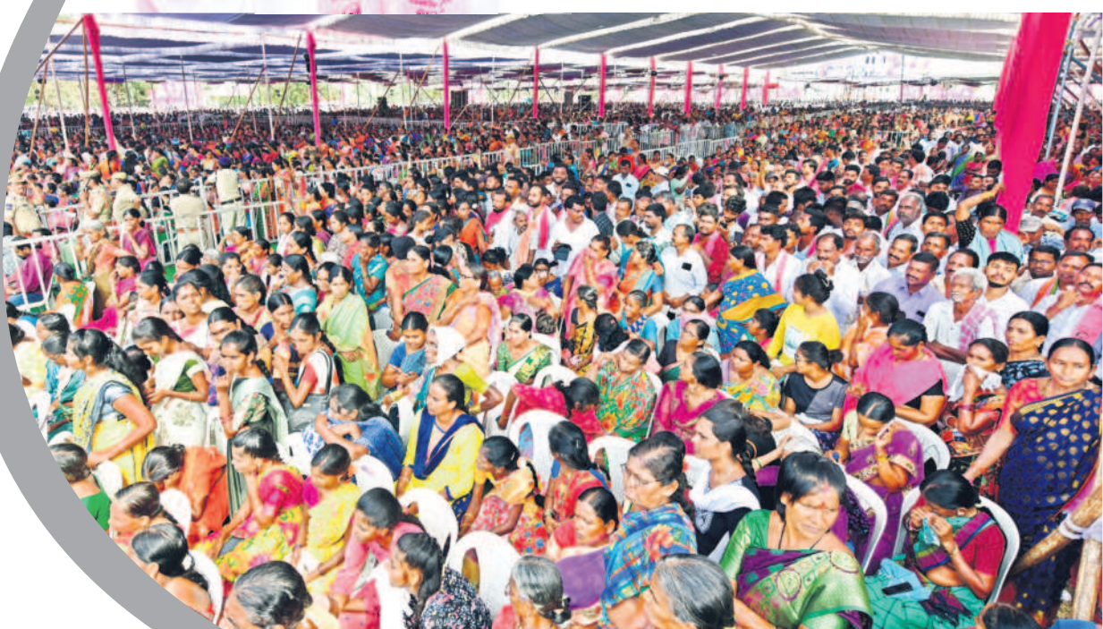
ఎల్ఎండీ కాలనీలోని శ్రీ చైతన్య కళాశాల ఆవరణలో నిర్వహించిన ప్రజా ఆశీర్వాద సభకు భారీగా హాజరైన ప్రజలు

- కరీంనగర్, నవంబర్ 20 (నమస్తే తెలంగాణ ప్రతినది) / కరీంనగర్ (నమస్తే తెలంగాణ)