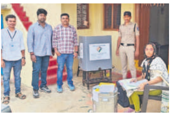
ఇంటి నుంచే ఓటు వినియోగించుకునేందుకు ఏర్పాట్లు చేసిన అధికారులు