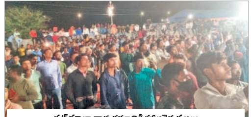
ఛట్ పూజా కార్యక్రమానికి హాజరైన ప్రజలు

అమీన్ పూర్, నవంబర్ 20 : ఉత్తర భారతీయులు ప్రతి ఏటా దీపావళి పర్వదిన సమయంలో వారం రోజులు పాటు నిర్వహించే ఛట్ పూజ కార్యక్రమాన్ని వైభవోపేతంగా పటాన్చెరు ప్రాంతంలో నిర్వహించడం ఆసవాదిత్ కొనసాగుతున్నది. అమీన్ పూర్ మండలంలోని పట్టణ గూడలో ఉత్తర భారతీయుల అసోసియేషన్ అధ్వర్యంలో సోమవారం ఛట్ పూజ కార్యక్రమాన్ని భారీ ఎత్తున నిర్వహించారు. ఈ కార్యక్రమానికి భోజీపురి సినీనటులు కేసరీ లాల్, అక్షర సింగ్ ముఖ్యఅతిథులు వచ్చి, తమ పాటలతో ప్రేక్షకులను మంత్ర ముగ్ధులను చేశారు. సంస్కృతిక, సంప్రదాయక కార్యక్రమాలను ప్రదర్శించారు. బీహార్, ఒడిస్సా, ఉత్తర ప్రదేశ్ కు చెందిన ప్రజలు భారీ సంఖ్యలో ఛట్ పూజా కార్యక్రమానికి హాజరయ్యారు. కార్యక్రమంలో ప్రజాప్రతినిధులు, ఉత్తర భారతీయుల అసోసియేషన్ నాయకులు పాల్గొన్నారు.