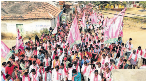
నారాయణరావుపేటలో ర్యాలీ నిర్వహిస్తున్న నాయకులు, కార్యకర్తలు