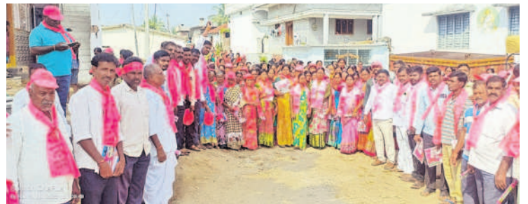
నంగునూరు : పాలమాకులలో ప్రచారం చేస్తున్న బీఆర్ఎస్ నాయకులు, కార్యకర్తలు