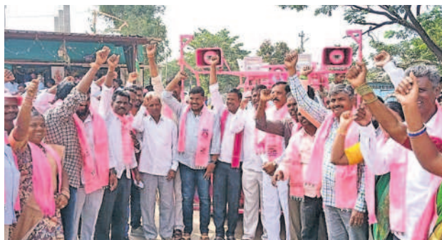
నారాయణరావుపేట : ప్రజాప్రతినిధుల సమక్షంలో బీఆర్ఎస్ లో చేరిన యువకులు