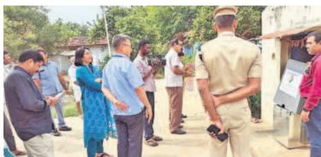
రాజగోపాల్ పేట్ లో ఇంటి నుంచి జరుగుతున్న ఓటింగ్ సరళిని పరిశీలిస్తున్న ఎన్నికల అభ్యర్థులు