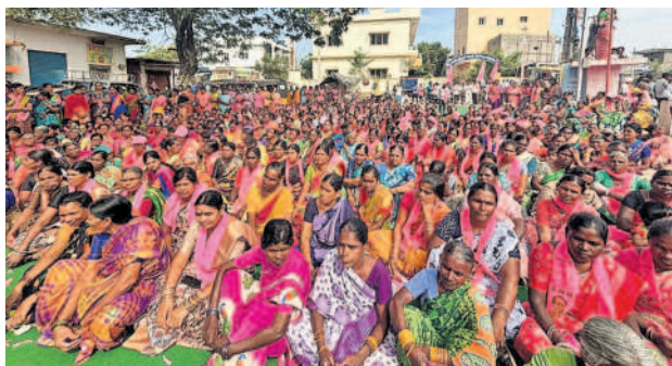
నారాయణరావుపేటలో సభకు హాజరైన ప్రజలు