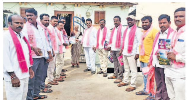
సిద్దిపేట కమాన్ : గాడిచర్లపల్లిలో ఇంటింటి ప్రచారం చేస్తున్న బీఆర్ఎస్ నాయకులు