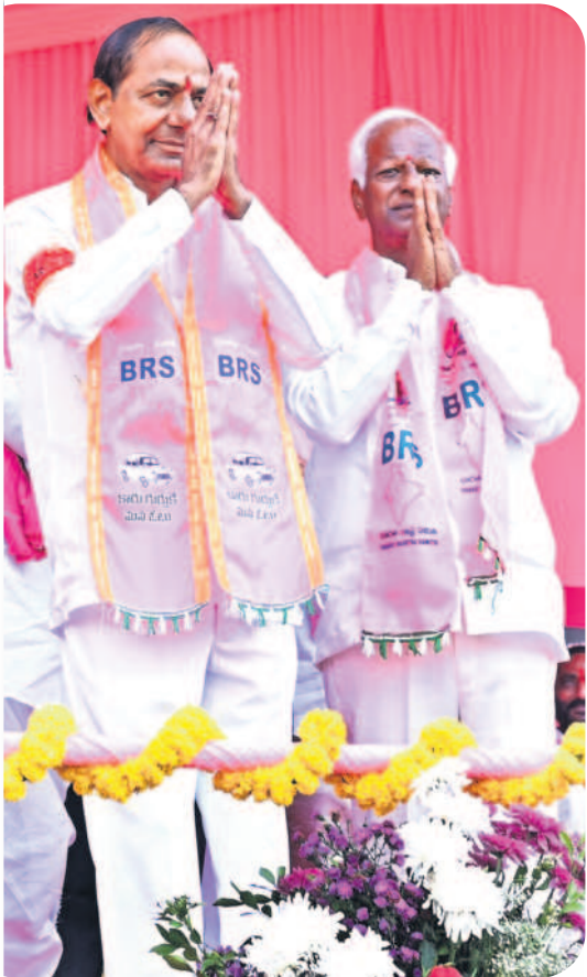
స్టేషన్ ఘనపూర్ సభకు పెద్ద ఎత్తున హాజరైన జనం, ప్రజలకు అభివాదం చేస్తున్న సీఎం కేసీఆర్, అభ్యర్థి కడియం శ్రీహరి