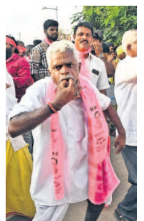
కాల వేస్తున్న వృద్ధుడు