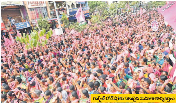
గజ్వేల్ రోడ్ షోకు హాజరైన మహిళా కార్యకర్తలు

గజ్వేల్ ఎంతలా మారిందో గమనించాలన్నారు. గత ప్రభుత్వాల హయాంలో నీళ్ల తండ్లాడిన గజ్వేల్ ప్రస్తుతం మల్లన్నసాగర్, కొండపోచమ్మ సాగర్ల నుంచి నల్గొండ, మెదక్కు నీళ్లను చంపు తున్నదన్నారు. ఎండకాలంలో మత్తడి దుంకు