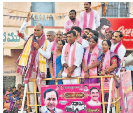
మాట్లాడుతున్న మంత్రి తన్నీరు హరిశ్చంద్రావు