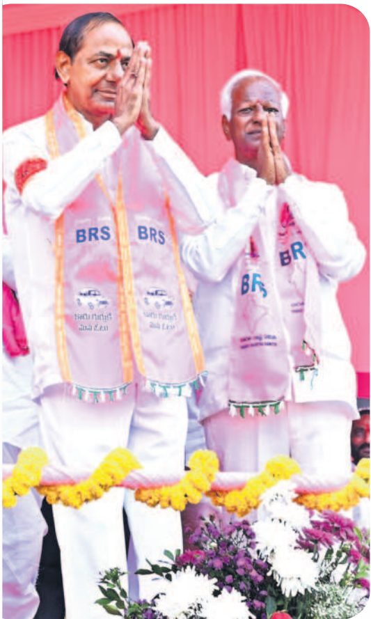
స్టేషన్ ఘనపూర్ సభకు పెద్ద ఎత్తున హాజరైన జనం, ప్రజలకు అభివాదం చేస్తున్న సీఎం కేసీఆర్, అభ్యర్థి కడియం శ్రీహరి