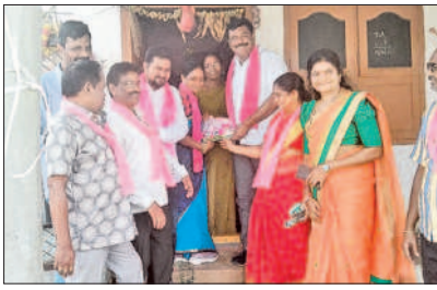
గీసుగొండ : 15వ డివిజన్ కిరీనగర్ కాలనీలో ప్రచారం చేస్తున్న బీఆర్ఎస్ నాయకులు