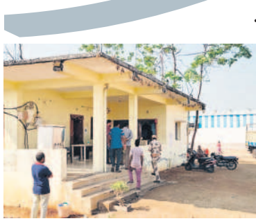
తాండూర్ మహాశ్వల జూనియర్ మిల్ లో సోదాలు చేస్తున్న ఐటీ అధికారులు