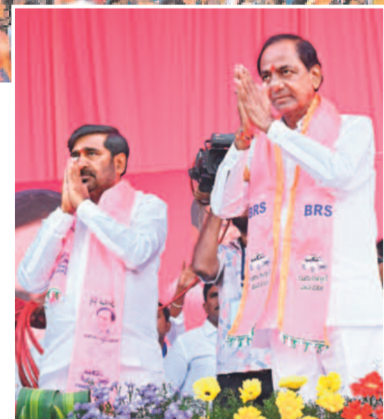
సూర్యపేటలో జరిగిన ప్రజా ఆశీర్వాద సభకు తరలివచ్చిన అనేకజనవాహినీకి అభివాదం చేస్తున్న ముఖ్యమంత్రి కేసీఆర్, బీఆర్ఎస్ అధ్యక్షుడు జగదీశ్ రెడ్డి.

'చందేలోనికి ఎరుక గూనివాటం' అన్నట్లు మన తెలంగాణ యవ్వారం ఏంటో మనకు తెలుస్తది. మనం రైతాంగానికి ఉచిత కరెంటు ఇస్తున్నం. 'మవ్ కర్మితంగా ప్రతి బావికి, ప్రతి మోటర్ కు మీటర్లు పెట్టాలి' అని మోటి అంటుంది. 'నా ప్రాంతం పోయినా నేను పెట్టను' అని చెప్పిన. అందుకు వాళ్లు ఒకటికాదు.. రెండు కాదు.. 25 వేల కోట్ల రూపాయలు మనకు రాకుండా అపిండ్లు. వచ్చే బడ్జెట్ కు కట్ చేస్తాను. ఇదే విషయాన్ని హైదరాబాద్ లో నిర్వహించిన కార్యక్రమం మోటర్లకు మీటర్లు > 2వ పేజీలో హైదరాబాద్, నవంబర్ 21 (నమస్తే తెలంగాణ): తెలంగాణకు కేంద్రంలోని బీజేపీ ప్రభుత్వం చేసిన, చేస్తున్న ద్రోహంపై సీఎం కేసీఆర్ చెప్పున్నదే నిజమని తెలిసింది. రైతులకు బీజేపీ, కాంగ్రెస్ పార్టీలు బద్ధ శత్రువులని, వ్యవసాయానికి ఇస్తున్న 24 గంటల ఉచిత కరెంటును ఆగం పట్టిస్తారని ఆయన చెప్పున్న హెచ్చరికలు అక్షర సత్యాలని తేలిపోయింది. తాము అధికారంలోకి వస్తే వ్యవసాయానికి 3 గంటల కరెంటు మాత్రమే ఇస్తామని కాంగ్రెస్ పార్టీ రాష్ట్ర హైదరాబాద్ లో నిర్వహించిన కార్యక్రమం అధ్యక్షుడు రేవంత్ రెడ్డి బాబాపా ప్రకటించిన మోటర్లకు మీటర్లు > 2వ పేజీలో