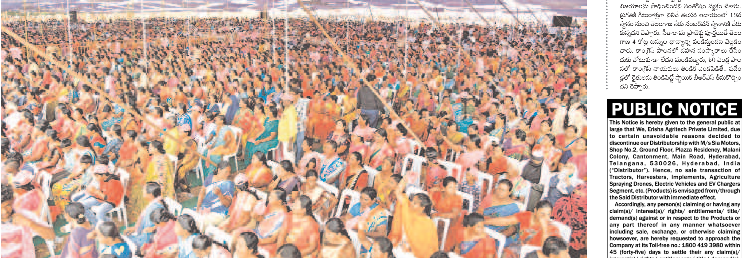
కిక్కిరిసిన మదీర: మంగళవారం ఖమ్మం జిల్లా మదీరలో నిర్వహించిన బీఆర్ఎస్ ప్రజాఅభివృద్ధి సభకు భారీగా తరలివచ్చిన ప్రజలు, బీఆర్ఎస్ శ్రేణులు

బీఆర్ఎస్ పార్టీ పుట్టిందే తెలంగాణ కోసమని, హక్కుల రక్షణ కోసమని సీఎం కేసీఆర్ వివరించారు. అది కారణాలతో వచ్చిన తర్వాత ఒక్క దగ్గర పెట్టుకుని పనిచేశామని చెప్పారు. అతి స్వల్పకాలంలోనే తెలంగాణ అనేక విజయాలను సాధించిన సంక్షోభం వ్యక్తం చేశారు. ప్రగతికి గీటురాళ్లుగా నిలిచే తలసరి ఆదాయంలో 19వ స్థానం నుంచి తెలంగాణ నేడు నంబర్ వన్ స్థానానికి చేరుకున్నదని చెప్పారు. సీతారామ ప్రాజెక్టు పూర్తయితే తెలంగాణ 4 కోట్ల డన్నుల దాన్యాన్ని పండిస్తుందని వెల్లడించారు. కాంగ్రెస్ పాలనలో దహన సంస్కారాలు చేసేందుకు చోటుకూడా లేదని మండిపడ్డారు. 50 ఏండ్ల పాలనలో కాంగ్రెస్ నాయకులు తిండికి ఎండపెడితే.. పదేండ్లలో రైతులను తిండిపెట్టే స్థాయికి బీఆర్ఎస్ తీసుకొచ్చిందని చెప్పారు.