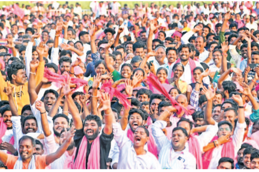
నింపుతమంటూ యమ ఆరాటపడుతున్నది. బంగాళాఖాతంలో ధరణిని కలిపి వెనకటి పెత్తందారీ పాలనకు తలుపులు బార్డు తీయాలని చూస్తున్నది.

ఈ మధ్యకాలంలో ముస్లింలు కాంగ్రెస్ వైపు మొగ్గారానికే అటువంటి అధికారం ఉంది. ఈ ప్రచారానికి ఎటువంటి ఆధారాలు లేవు. కానీ, ప్రచారాన్ని కొన్ని శక్తులు కావాలని సాగిస్తున్నాయి. బీజేపీని ఎదుర్కోవడంలో కాంగ్రెస్ పార్టీ చేతకానికాని దేశవ్యాప్తంగా ముస్లింలు గమనిస్తున్నారు. జాతీయ స్థాయిలో హాస్పిట్ బీజేపీకి కాంగ్రెస్కు మద్దతు పోవాలని సూచించుకుంటున్న కమిషన్లున్నాయి. కానీ, వాస్తవానికి బీజేపీని దేశ స్థాయిలో కాంగ్రెస్ లేదు. పశ్చిమబెంగాల్, తెలంగాణ తదితర అనేక రాష్ట్రాలలో ప్రాంతీయ పార్టీలే బీజేపీకి అడ్డుకట్ట వేస్తున్నాయి. మత విద్వేషాలు లేకుండా సామర్య పాలన ప్రాంతీయ పార్టీలు ఉంటేనే సాధ్యమవుతుందనే అవగాహన ముస్లింలు ఉన్నది. రాజస్థాన్, మధ్య ప్రదేశ్, గుజరాత్, హిమాచల్ ప్రదేశ్, ఉత్తరాఖండ్ మొదలైన రాష్ట్రాలలో బీజేపీకి, కాంగ్రెస్కు మధ్య పోటీ ఉన్నది. ఈ రాష్ట్రాలలో మత విద్వేషాలను కనబడకుండానే లోకీశక్తులు కాంగ్రెస్ బలంగా ఉదాహరించుకుంటున్న మాట నిజం. కానీ, ఈ రాష్ట్రాలలో కాంగ్రెస్ పార్టీ బీజేపీని గట్టిగా ఎదిరించడం లేదు. ఆ పార్టీ నేత రాహుల్ గాంధీ కూడా మోడికి డీటుగా వ్యవహరించడం లేదు. గుజరాత్, మధ్యప్రదేశ్ వంటి రాష్ట్రాలలో బీజేపీ వ్యతిరేకత కొద్ది ప్రజలు అసెంబ్లీ ఎన్నికల్లో కాంగ్రెస్ పార్టీకి అధికారం అప్పగించినా, ఆ విషయాలను స్థిరపరచుకోవడంలో కాంగ్రెస్ పార్టీ నాయకత్వం