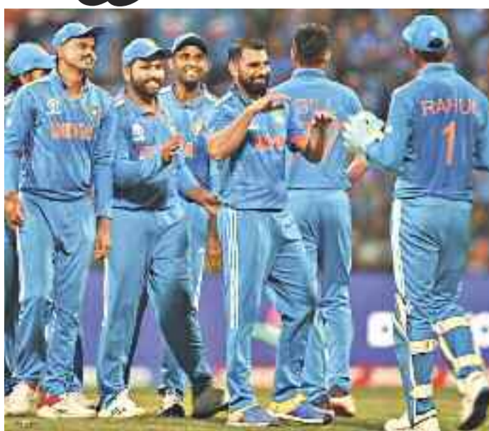
బాగుంటుంది అన్నాడు. అయితే స్టార్ క్రికెటర్లు బర్గు విరాట్ కోహ్లా, రోహిత్ శర్మ, స్టీవ్ స్మిత్, కేన్ విలియంసన్, జో రూట్, ప్యాట్ కమిన్స్ డంలో వన్డే ఫార్మాట్ ను మించింది లేదని వంటి వాళ్ల వాదన ఇందుకు భిన్నంగా కనిపిస్తున్నది. ఓ ఫేయిలోని నైపుణ్యం, సహనశీలత, పట్టుదల, పోరాట పటిమను పరీక్షించడంలో వన్డే ఫార్మాట్ ను మించింది లేదని వంటి వాళ్ల వాదన ఇందుకు భిన్నంగా కనిపిస్తున్నది.

జెంటిల్ మన్ గేమ్ గుర్తింపు తెచ్చుకున్న క్రికెట్ లో.. సుదీర్ఘ పాఠ్యాభ్యాసం వినోదాన్ని సందర్భంలో వన్డేలు పురుషుల పోషకులు. మొదట 60 ఓవర్లతో ప్రారంభమై.. కాలక్రమేణా రూపాంతరం చెందుకుంటూ.. ప్రస్తుతం ఉన్న స్థితికి చేరావు. అయితే 'ముందు వచ్చిన చెవుల కన్నా వెనక వచ్చిన కొమ్ములు వాడి' అన్నట్లు.. వన్డేల తర్వాత అంతర్జాతీయ క్రికెట్ లో అడుగుపెట్టిన టీ20లు ప్రజాదరణలో దూసుకుపోతున్నాయి. ప్రజల జీవన విధానంలో మార్పులు రావడంతో పాటు.. 8 గంటల వెబ్ లైవ్ వన్డే మ్యాచ్ చూసే సమయం అభిమానులకు సైతం లేకపోవడంతో రానున్న కాలంలో వన్డేల ప్రభావం తగ్గిపోవడం ఖాయమే అని పులుపురు అంచనాలు వేస్తున్నాయి. తాజా ప్రపంచకప్ సక్సెస్ తో నిర్వాహకులు సైతం ఆనందంగానే ఉన్నారు. మున్ముందు మాత్రం సచిన్ టెండూల్కర్, వసీమ్ అక్రమ్ సూపర్ స్టార్లు అవుతుంటే తప్పని పరిస్థితి కనిపిస్తున్నది.