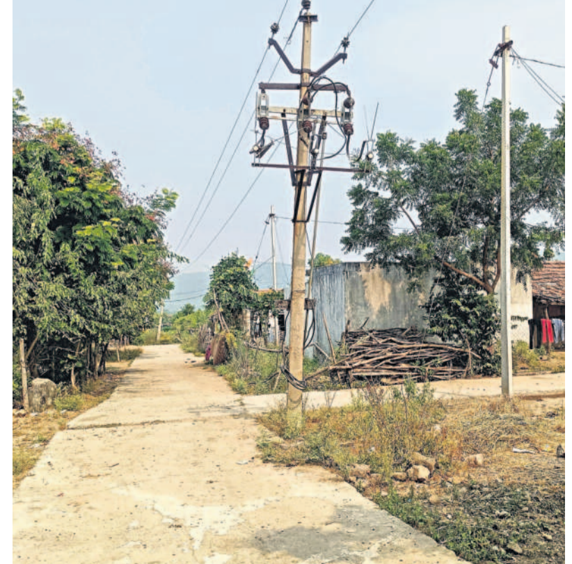
అంటాగా గ్రామంలో నిర్మించిన సీసీ రోడ్లు

పల్లె ప్రగతితో మంత్రి హనుమంత్రెడ్డి (సైల్)