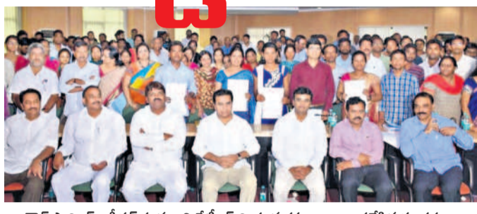
బీఆర్ఎస్ సర్కారు అధ్యక్షుడు మంత్రి కేటీఆర్ నియామకవేత్రాలు అందజేసిన సందర్భం