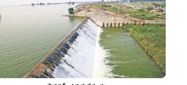
పావగిరి - తిరుమల సముద్రం

2014-15 నాటికి సాగునీరిచ్చింది: 7,50,623 ఎకరాలకు వరి ధాన్యం దిగుబడి: 8,20,453 టన్నులు 2022-23 నాటికి సాగునీరిస్తున్నది: 13,42,441 ఎకరాలు వరి ధాన్యం దిగుబడి: 44,60,064 టన్నులు