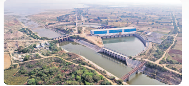
ఎవలమ్మ పునరుద్ధక ప్రాజెక్ట్

2013-14 నాటికి సాగునీరిచ్చింది: 4,28,888 ఎకరాలకు వరి ధాన్యం దిగుబడి: 2,62,787 టన్నులు 2022-23 నాటికి సాగునీరిస్తున్నది: 10,25,232 లక్షల ఎకరాలు వరి ధాన్యం దిగుబడి: 27,61,659 టన్నులు