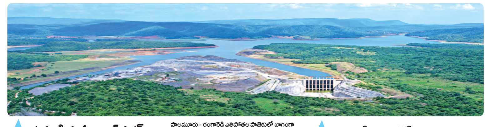
పాలముడు - రంగారెడ్డి ఎత్తిపోతల ప్రాజెక్టులో భాగంగా నిర్మించిన నాల్గవూర్ రిజర్వాయర్

2014-15 నాటికి సాగునీరిచ్చింది: 2,43,303 ఎకరాలకు వరి ధాన్యం దిగుబడి: 2,39, 779 టన్నులు 2022-23 నాటికి సాగునీరిస్తున్నది: 7,99,219 ఎకరాలు వరి ధాన్యం దిగుబడి: 24,99,629 టన్నులు