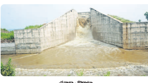
భద్రా - కొండా

2013-14 నాటికి సాగునీరిచ్చింది: 1,39,169 ఎకరాలకు వరి ధాన్యం దిగుబడి: 1,51,598 టన్నులు 2022-23 నాటికి సాగునీరిస్తున్నది: 8,00,805 లక్షల ఎకరాలకు వరి ధాన్యం దిగుబడి: 8,18,215 టన్నులు