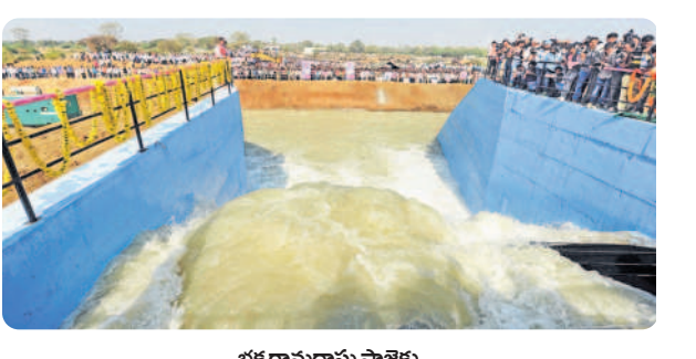
భక్త రామదాసు ప్రాజెక్టు

2013-14 నాటికి సాగునీరిచ్చింది: 2,53,300 ఎకరాలకు వరి ధాన్యం దిగుబడి: 3,69,342 టన్నులు 2022-23 నాటికి సాగునీరిస్తున్నది: 3,95,055 ఎకరాలు వరి ధాన్యం దిగుబడి: 10,69,536 టన్నులు