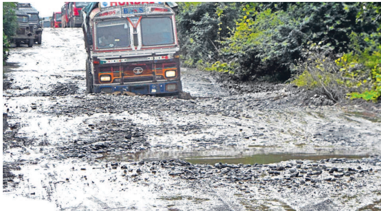
పాలకులు కండ్లకు గంతలు కట్టుకుంటే... రహదారులపై గంతలు ఉండకేం చేస్తాయి! ఆనాటి నిర్లక్ష్య పాలనకు ప్రత్యక్ష ఉదాహరణ ఈ చిత్రం. నిలువెత్తు లోతులను భారీ లారీ సైతం భయంగా దాటాల్సిందే! ఇక సాధారణ ప్రయాణీకులకు దినదిన గండమే! అత్యవసర పరిస్థితుల్లో ఈ దారిలో వెళ్లాలి వస్తే దేవుడిపై భారం వేసేవారే అదిలాబాద్ అనివాసీలు. అదిలాబాద్ జిల్లా జైనాద్ మండలం బోరజీ గ్రామం నుంచి బేల మండలం శంకర్ గూడ (మహారాష్ట్ర సరిహద్దు) కు వెళ్లే జాతీయ రహదారి 375 దుస్థితి ఇదిగో ఇలా ఉండేది.