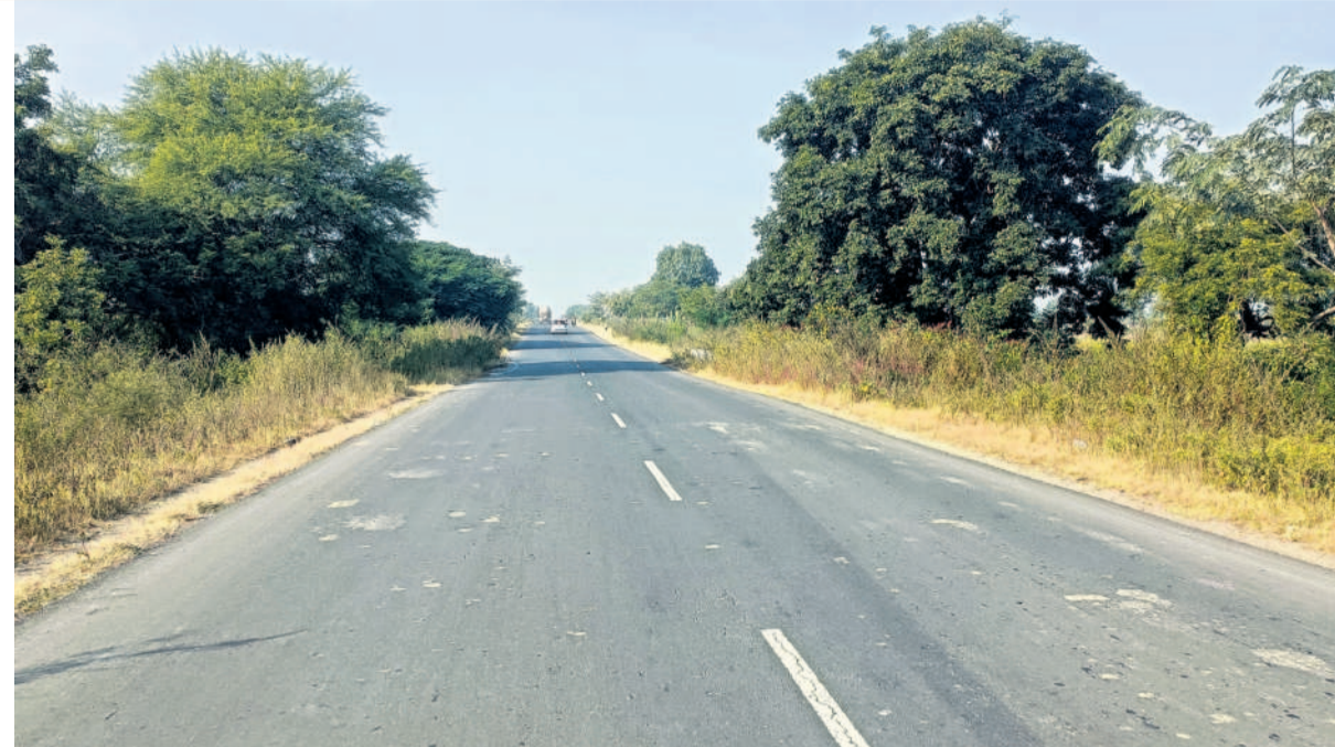
వడ్డించేవాడు మనవాడయితే నగరం నడిబొడ్డున మాత్రమే కాదు, మారుమూల కుగ్రామంలోనూ అభివృద్ధి అప్రతిహతంగా సాగుతుందనడానికి ఈ చిత్రం సాక్ష్యం. స్వరాష్ట్ర సాధనలో మా దారి రహదారి అని దూసుకుపోయిన గులాబీ నేత.. తెలంగాణలోని దారులన్నిటినీ అద్దాల తీర్చిదిద్దారు. దశాబ్దాలుగా రాళ్లబాటలో నడిచిన పల్లెవాసులకు రావబాటను కానుకగా ఇచ్చారు. ఇప్పుడు జైనాద్, బేల మండల వాసులు మహారాష్ట్రకు దర్భాగా రాకపోకలు సాగిస్తున్నారు. 15 గ్రామాల పరిధిలోని 32 కిలోమీటర్ల దారిని రూ.47 కోట్లతో అభివృద్ధి చేశారు.