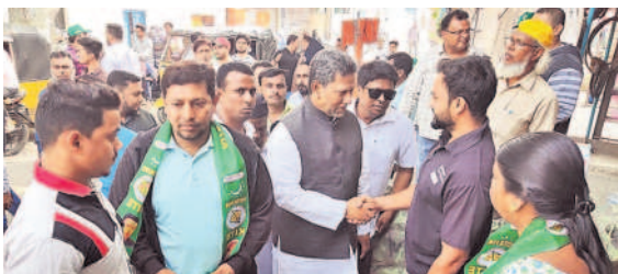
కార్యాలయ నియోజకవర్గంలోని పలు ప్రాంతాల్లో ప్రచారం నిర్వహించిన ఎంఐఎం అభ్యర్థి, ప్రస్తుత ఎమ్మెల్యే కౌసర్ మొహినుద్దీన్ తో పాటు మజ్లీస్ నాయకులు, కార్యకర్తలు. - కార్యాలయ, నవంబర్ 21