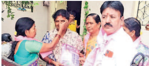
ఉండమ్మా బొట్టు పెడుతా..