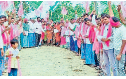
కన్నాయిగూడెం : ప్రచారంలో బీఆర్ఎస్ శ్రేణులు