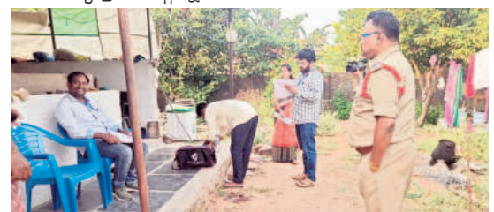
ఓటు వేయించుకునేందుకు వచ్చిన ఎన్నికల అధికారులు