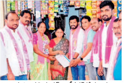
భూపాలపల్లి రూరల్ : లక్ష్మీనగర్ లో ప్రచారం