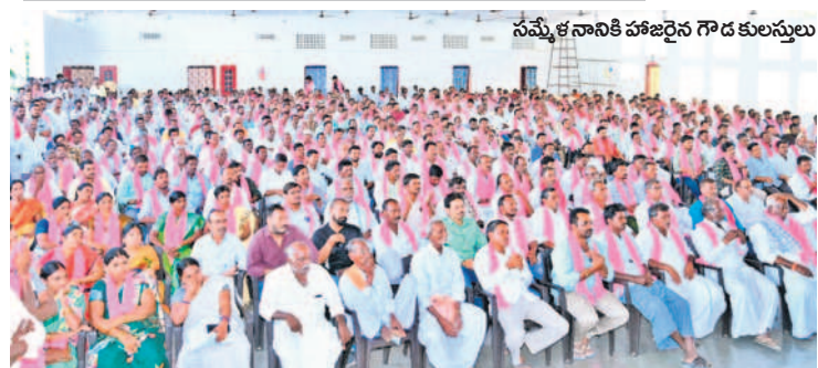
సమ్మేళనానికి హాజరైన గౌడ కులస్తులు