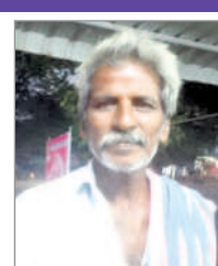
-చలిగంజి తిరుమల, తల్లాడ

కాంగ్రెస్ అధికారంలోకి వస్తే మూడు గంటల కరెంట్తో రైతులు ఆగమయ్యే పరిస్థితి వస్తుంది. సీఎం కేసీఆర్ 24 గంటలు ఇస్తుంటేనే తెలంగాణ రాష్ట్రం ధాన్యరాసులతో తులతూగుతున్నది. అటువంటి తెలంగాణలో కాంగ్రెస్ అడుగు పెడితే తెలంగాణ రాష్ట్రం కరువు తాండవించే పరిస్థితులు నెలకొంటాయి. రైతులు ఆలోచించి కారు గుర్తుకు ఓటు వేయాలి.