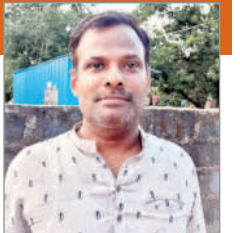
-గడిపూడి రాజా, రైతు, తాళ్లచెరువు, తిరుమలాయపాలెం మండలం

చిన్న, సన్నకారు రైతులు 10హెచ్పీ మోటర్లు ఏర్పాటు చేసుకోవడం ఎలా సాధ్యమవుతుంది. 10హెచ్పీ మోటర్లు అయితే మూడు గంటల కరెంటు సరిపోతుందని కాంగ్రెస్ నాయకులు అంటున్నారు. రూ.లక్షలు ఖర్చు చేసి ఒకటి రెండు ఎకరాల రైతులు 10హెచ్పీ మోటర్లు ఎలా పెట్టుకుంటారు. కాంగ్రెస్ గొర్తుమెంటు వస్తే సన్న, చిన్నకారు రైతులకు ఇబ్బందులు తప్పవు. బీఆర్ఎస్ పాలనలో 24 గంటల కరెంటు వస్తుంటే హాయిగా ఎప్పుడంటే అప్పుడు మోటర్లు పెట్టుకొని పొలం తడుపుకొంటున్నాం. కాంగ్రెస్ గెలిస్తే మలనాటి చిన్న రైతులకు కష్టాలు తప్పవు. సన్న, చిన్నకారు రైతులు మళ్ళీ బీఆర్ఎస్ ప్రభుత్వాన్ని గెలిపించుకోవాలి.