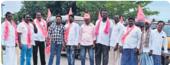
వైరా రూరల్ : ప్రజా ఆశీర్వాద సభకు తరలుతున్న బీఆర్ఎస్ శ్రేణులు