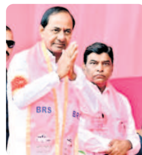
మాట్లాడుతున్న సీఎం కేసీఆర్

వైరా టౌన్, నవంబర్ 21 : వైరా సభా వేదికపై కూడా ఎంపీ నామా నాగేశ్వరరావు రైతు సేవలపై సీఎం కేసీఆర్ ప్రశంసల జల్లు కురిపించి ఆయన వైపు చూస్తూ రైతులకు చేసిన సేవలను వేలాది మంది ప్రజల సాక్షిగా గుర్తు చేశారు. సీఎం కేసీఆర్ ఏం అన్నారో ఆయన మాటల్లోనే... ఖమ్మం ఎంపీ నామా నాగేశ్వరరావు ఈ మధ్య నన్ను కలిశారు. వైరా ప్రాజెక్టులో నీటి నిల్వలు లేక