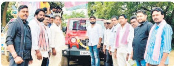
బింతకాని : సీఎం సభకు తరలిన నాయకులు, కార్యకర్తలు, అభిమానులు