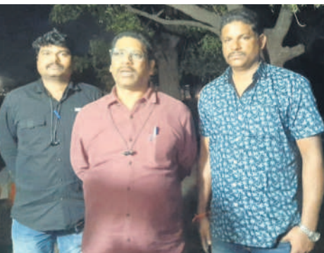
వివరాలు వెల్లడిస్తున్న ఏసీబీ అధికారులు