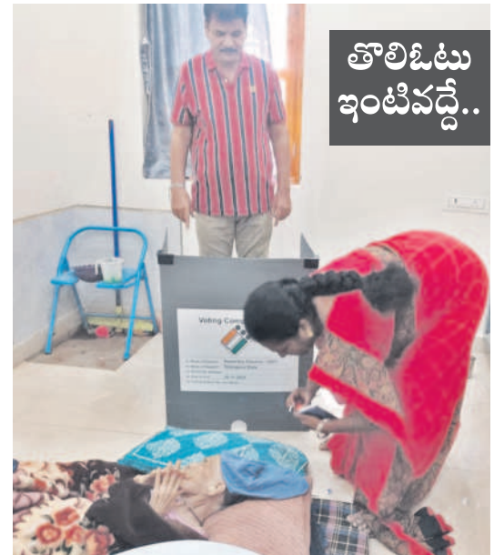
తొలి ఓటు ఇంటివద్దే..